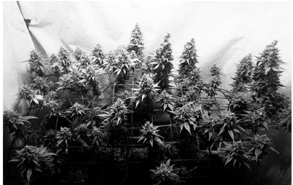
Bristol, 30×20cm Agfa Sensor + Kodak Trix 400 Tiratura: 4/4 digitale + 1 analogico