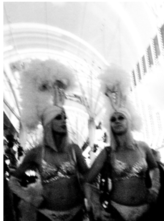
Downtown Las Vegas #2, 32×40cm Yashica T5 + Kodak Trix 400 Tiratura: 4/4 digitale + 1 analogico