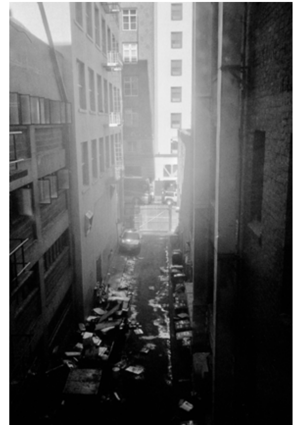
Tenderloin , 110×165cm Yashica T5 + Kodak Trix 400 Tiratura: 4/4 digitale + 1 analogico