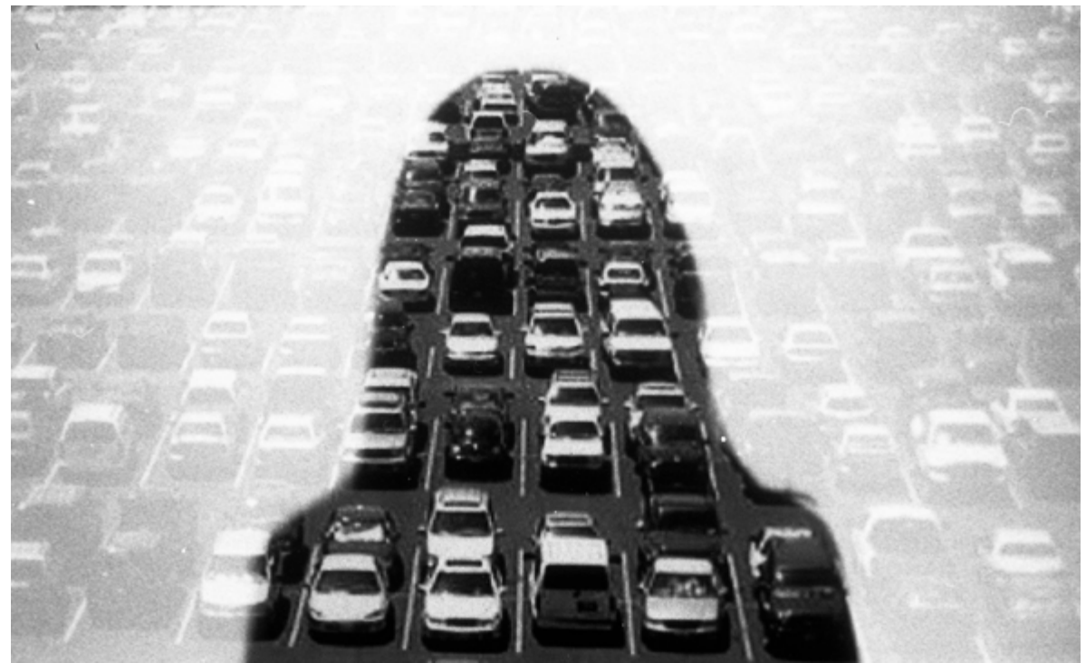
Black Out , 95×60cm Nikon FM2 + Kodak Trix 400 Tiratura: 4/4 digitale + 1 analogico