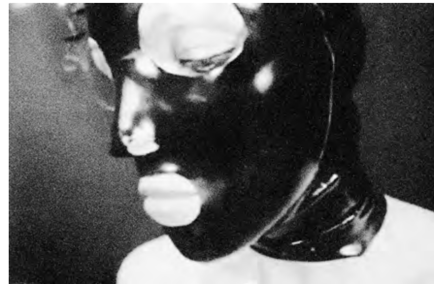
Ragusa Ibla #3, 46×30cm Nikon FM2 + ILFORD DELTA 3200 Tiratura: 4/4 digitale + 1 analogico