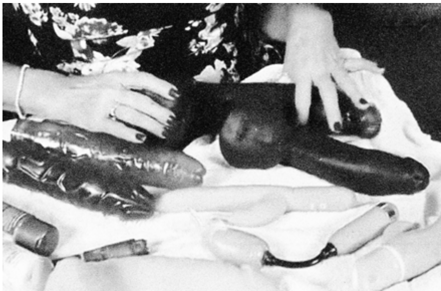
Ragusa Ibla #4 , 46×30cm Nikon FM2 + ILFORD DELTA 3200 Tiratura: 4/4 digitale + 1 analogico