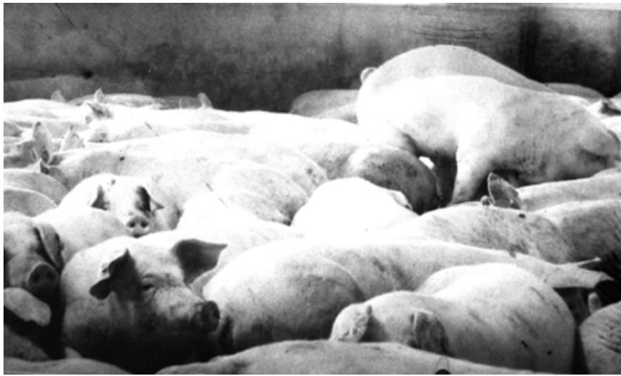
Untitled , 30×20cm Nikon FM2 + Kodak Trix 400 Tiratura: 4/4 digitale + 1 analogico