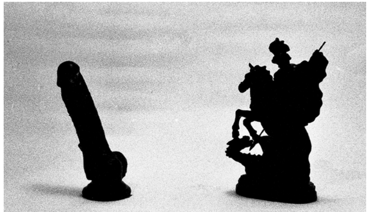
Ragusa Ibla #2 , 86×50cm Nikon FM2 + ILFORD DELTA 3200 Tiratura: 4/4 digitale + 1 analogico