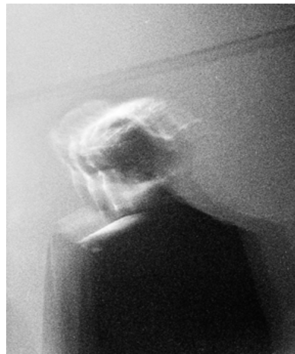
Untitled , 50×60cm Yashica T5 + Kodak Trix 400 Tiratura: 4/4 digitale + 1 analogico