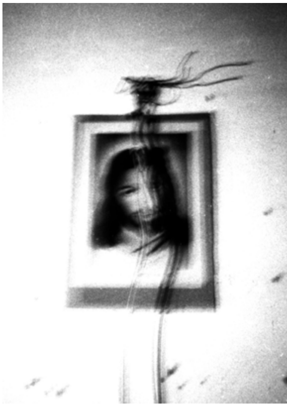
Hell end in Hell #2, 34×40cm Yashica T5 + Kodak Trix 400 Tiratura: 4/4 digitale + 1 analogico