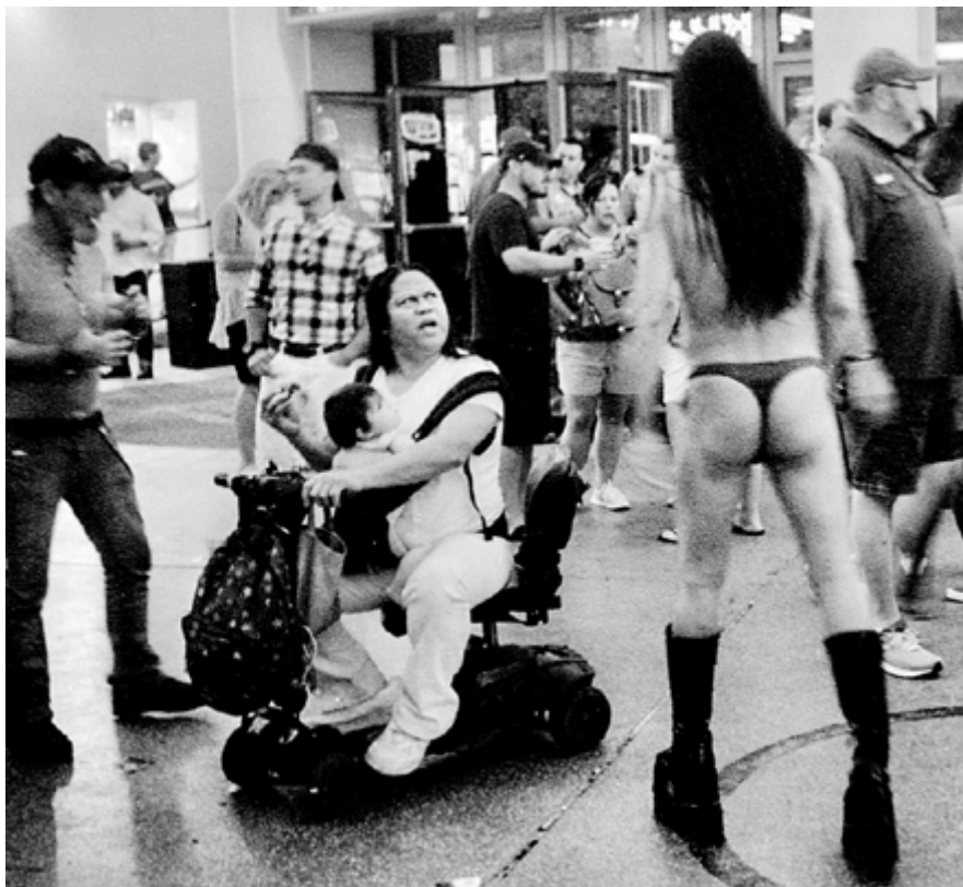
Downtown Las Vegas #1, 120×110cm Yashica T5 + Kodak Trix 400 Tiratura: 4/4 digitale + 1 analogico