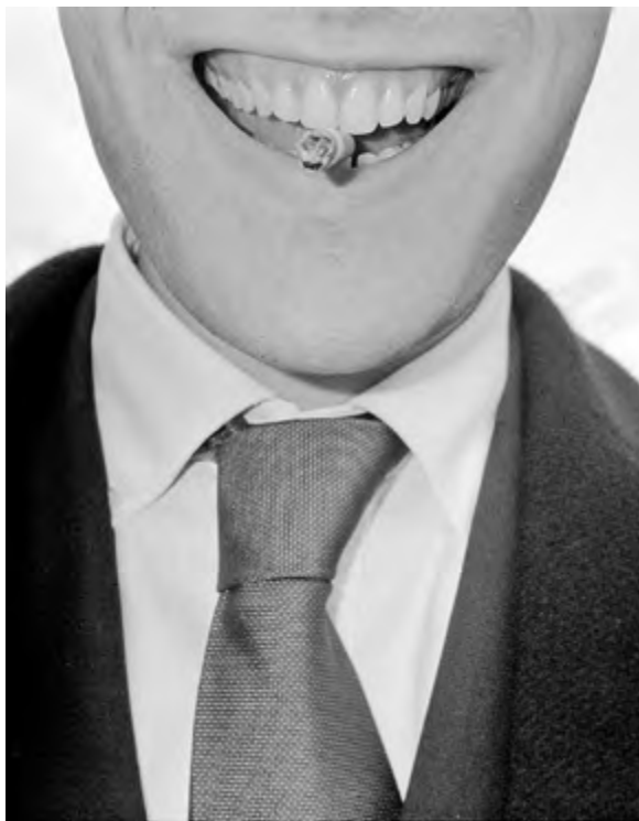
Ragusa Ibla #1 , 90×110cm Nikon FM2 + Kodak Trix 400 Tiratura: 4/4 digitale + 1 analogico