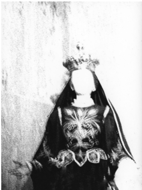
Hell end in Hell #1, 30×40cm Yashica T5 + Kodak Trix 400 Tiratura: 4/4 digitale + 1 analogico